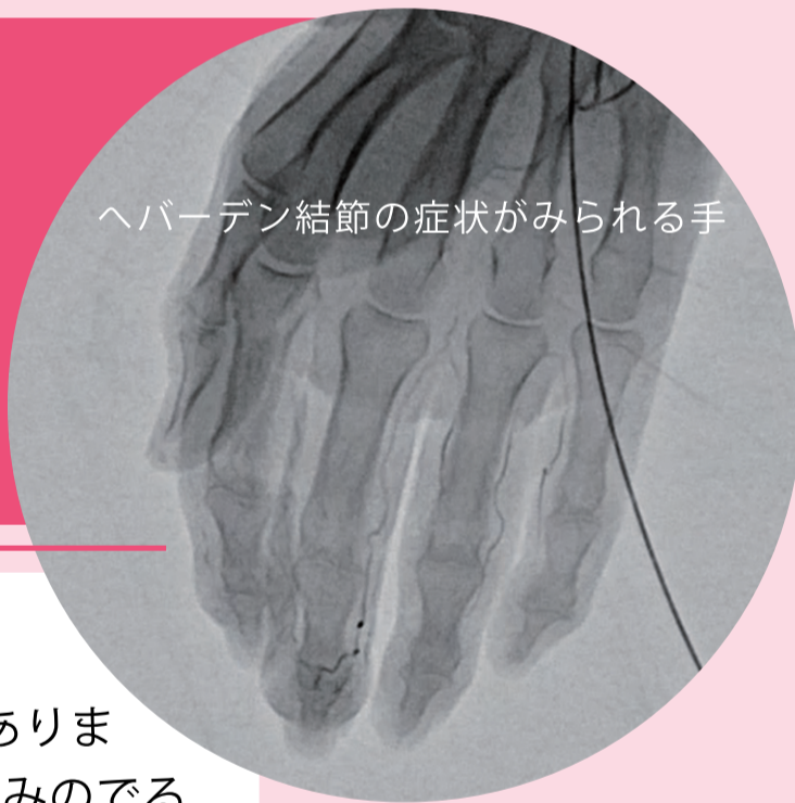
ヘバーデン結節の症状がみられる手