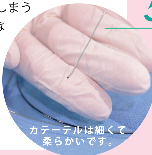
カテーテルは細くて 柔らかいです。